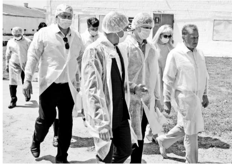
Визит губернатора состоялся в рабочий день. В цехах фабрики кипела работа.