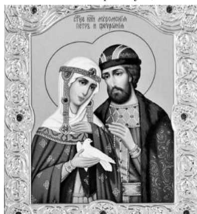
Икона Петра и Февронии — святых покровителей брака и семьи.

Любите тех, кто Вам протянет руку И никогда, и никому Вас не отдаст.